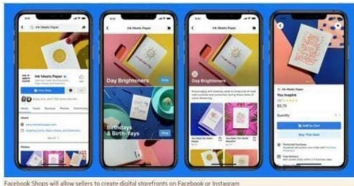
Facebook Shops will allow sellers to create digital storefronts on Facebook or Instagram

"Facebook Shops" zal het voor verkopers mogelijk maken om digitale winkels te creëren op Facebook of Instagram.