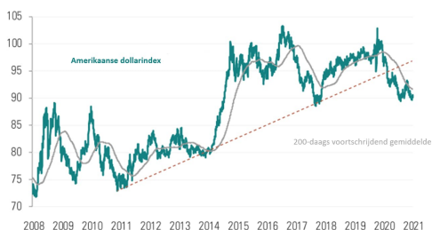
ONTWIKKELING VAN DE AMERIKAANSE DOLLARINDEX SINDS 2008

Bron: Bloomberg, 07/06/2021. De Amerikaanse dollarindex meet de waarde van de dollar tegenover een mandje van de belangrijkste valuta's ter wereld.