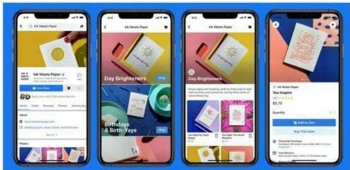
Facebook Shops will allow sellers to create digital storefronts on Facebook or Instagram

Avec Facebook Shops, les commerçants pourront créer leur boutique virtuelle sur Facebook ou Instagram.